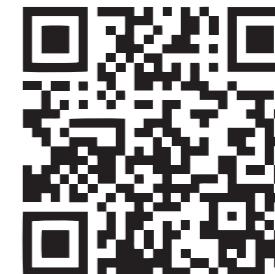
Uns findet man auch auf Instagram unter 📷 werkroute_aachen