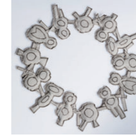
Henrike Altes Jewellery Schmuckdesign Tokens which strengthen our soul 🌐 henrikealtes.com 📷 henrike_altes