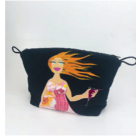
Beate Zwick-Ebner Textildesign und Upcycling Aus alt mach neu – Hauptsache Frottee 🌐 textildesign-aachen.de