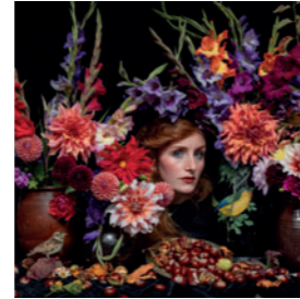
Gloria Jansen Fotografie Traumhafte Fotografien, Postkarten & Fine Art Prints 🌐 gloriajansen.com 📷 gloria_jansen