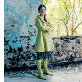
Susanne Hinz Textildesign Mode & Accessoires, Schönfarbig & handgemacht 🌐 susannehinz.de 📷 susannehinztextildesign