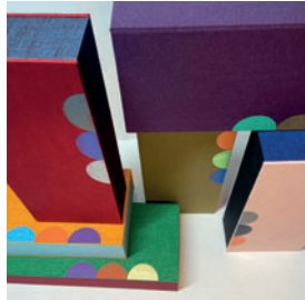
Adelheid Siegeroth Buchbinderin/Papeterie 🌐 papierdesign-siegeroth.de