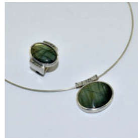
Goldschmiede Comouth Unser Schmuck – von Hand und mit Herz gefertigt 🌐 goldschmiede-comouth.de 📷 goldschmiede_comouth