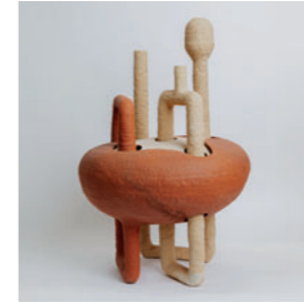
Barbara Reiter Keramikgestalterin Atelier mit Galerie 🌐 keramik-b-reiter.de 📷 barbara.reiter.keramik