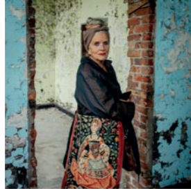
Jott and Daughters Wunderbare Taschen und Rucksäcke (aus alten Stoffen) 🌐 jottanddaughters.com 📷 jottanddaughters