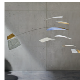
Anette Rawe Schön rumhängen – Mobilés für Haus und Garten! 🌐 a-rawe.de 📷 annetterawe_mobiles