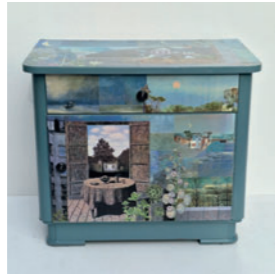
Catrin Tihon – Das Stückwerk Ausrangierte Möbel werden zu Lieblingsstücken 🌐 das-stueckwerk.de 📷 das_stueckwerk